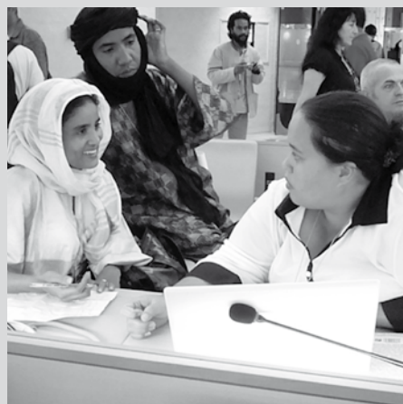
Indigene Delegierte an der UNO

INCOMINDIOS verwaltet den Fonds; die Entscheidungsfindung findet zusammen mit den Partner-NGOs Ti Tlanizke (Basel) und DoCip (Genf) statt. 2009–2010 betrug die Summe des zweijährigen DEZA-Mandats CHF 150'000 pro Jahr.