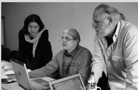
Stimmungsbild vom EUROTREFFEN in Berlin.