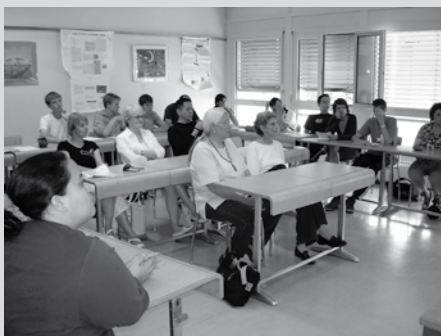
Indigene LehrerInnen besuchen Schweizer Schulklasse unter Leitung der AG Inschu.

Aus der Vergangenheit lernen – Kulturelle Vielfalt stärken