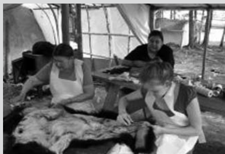
Beim Fett «abkratzen» eines Bärenfells